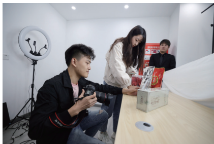
学生在抓紧补拍“双11”带货的商品。