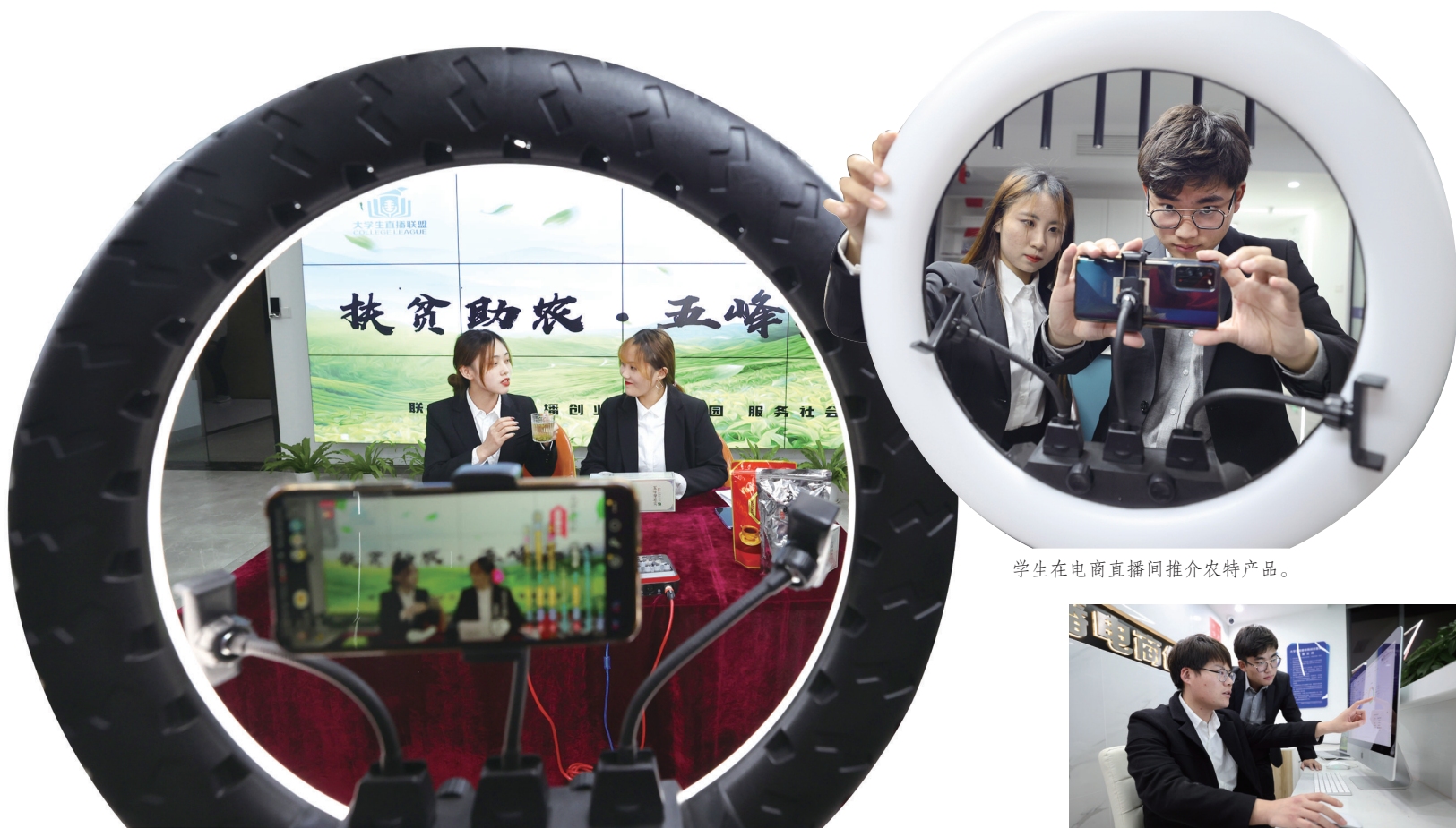
学生在电商直播间推介农特产品。