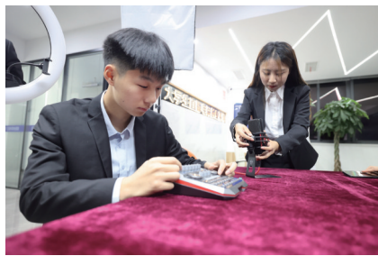
同学在直播前调试直播设备。