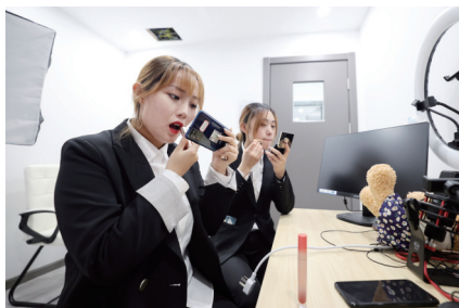
担任出镜的学生在直播前化妆。