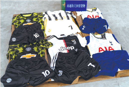
查获的侵权运动服。 通关

晚报讯 11月16日,南通海关依法扣留110套出口涉嫌侵犯尤文图斯、托特纳姆热刺、曼联足球俱乐部队徽图形商标权的运动服。