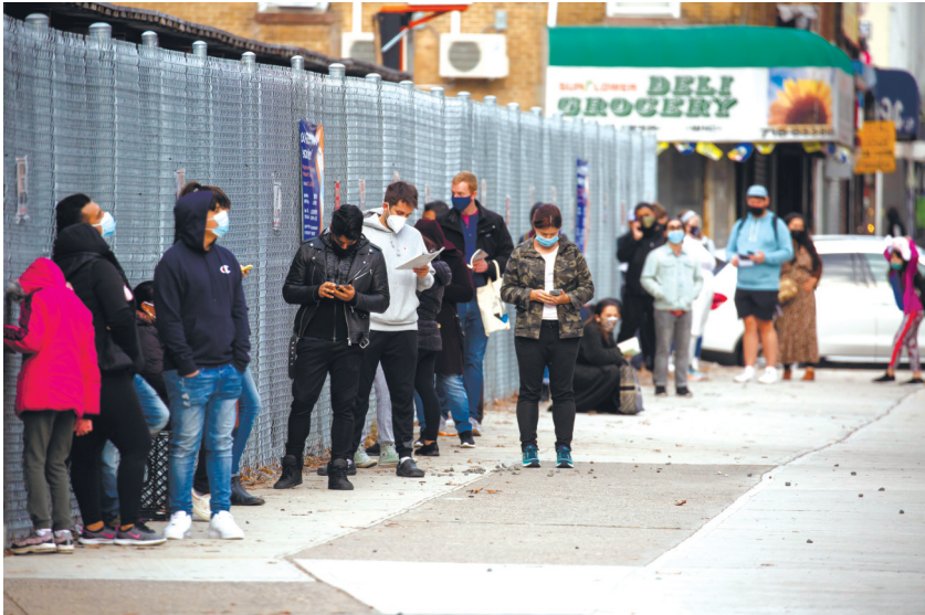
11月21日,人们在美国纽约排队等待接受新冠病毒检测。

美国疾病控制和预防中心19日呼吁美国人感恩节期间待在家中、不要出行,以防感染新冠病毒。一些州长无视这一提示,要么不愿发布防疫限制措施,要么公开自己的节日聚会计划,甚至鼓励居民小规模聚会。美联社20日援引美国公共卫生协会主席乔治·本杰明的观点报道,这些州长正向居民释放“非常危险的信号”。