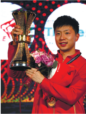
男单冠军马龙在颁奖仪式上捧杯。

“比分虽然是4:1,但每局都非常累,我觉得樊振东也非常累,因为彼此都在限制对手,比较费脑子,我今天赢在关键球处理得比较好。”马龙说,“最近两次同樊振东的比赛都打满了7局,输球很可惜,我非常渴望能够拿到冠军,也非常荣幸能够战胜世界第一。”