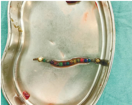
▲从女童体内取出的磁力珠。 ▼女童的X光片。