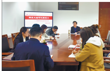
我与校长面对面——新进教师专场