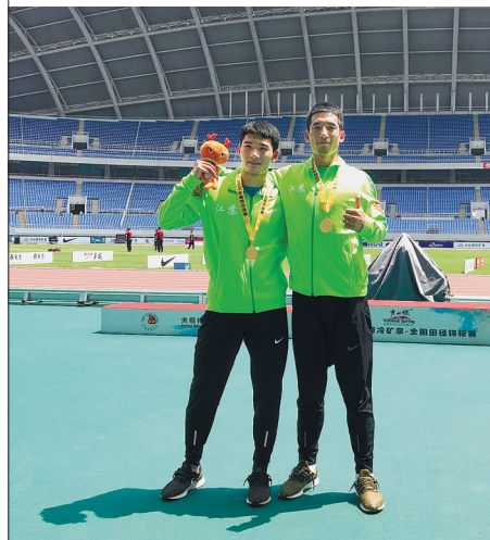
学生获得全国田径锦标赛冠军