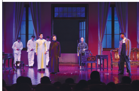
学生表演话剧《雷雨》