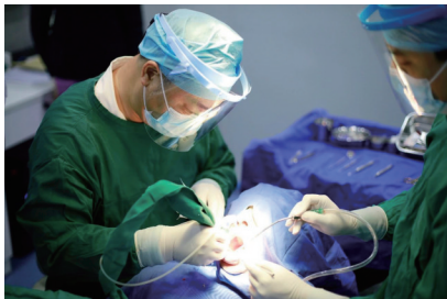
严重牙周病导致缺牙受苦 拖延半年又掉2颗

不知不觉,2020年接近尾声,冬至也即将如约而至!家人团圆,好不容易聚在一起吃香喝辣,可上了年纪的中老年人牙齿缺失,即使美味佳肴摆在眼前,想吃却嚼不动!为了让更多通城市民抓住年底最后机会重塑齿间幸福,南通专业口腔机构联合品牌种植厂商,开启年终感恩回馈,“进口种植体每颗仅需880元”的钜惠更是全城聚焦,掀起一股种好牙迎新年热潮!现在咨询来院即有价值690元爱牙检查礼包送给你,专家挂号、CT检查、方案设计费全免!