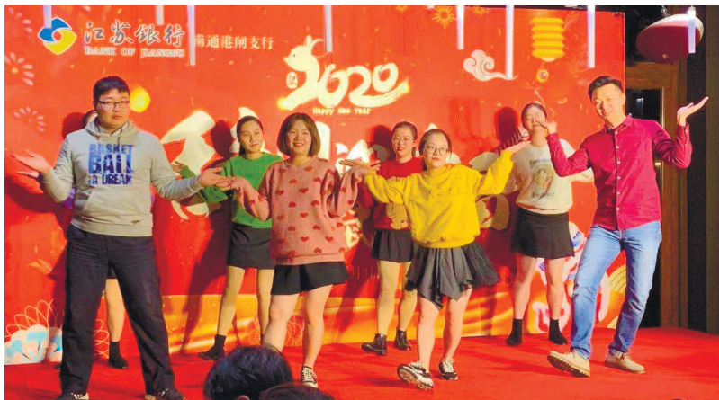
江苏银行港闸支行分工会2020年员工家属联谊。

江苏银行南通港闸支行分工会依托“职工小家”这个温馨平台，给业务发展带来无限生机和活力。分工会将立足职工利益和需求，以更坚定的决心、更饱满的热情、更高效的服务，把满意留给客户，把温情传递给员工，持续推动工会工作取得新发展，推动高质量发展再上新台阶。