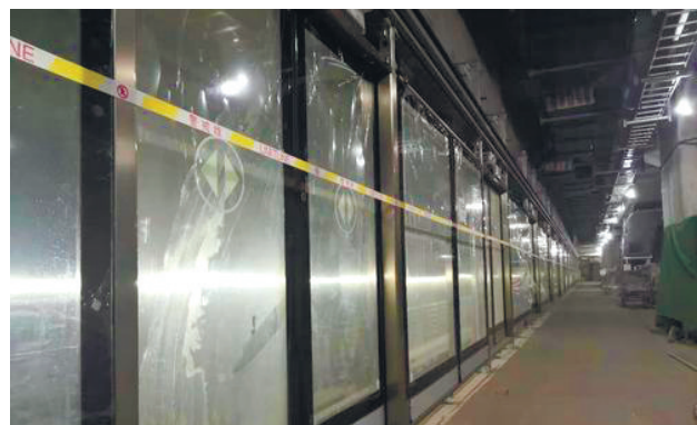
集成村站站台门完成门体安装。

站台门系统设置于地铁站台边缘,将列车与地铁站台候车区域隔离开,在列车到达和出发时可自动开启和关闭,有效防止人员或物体落入轨道发生意外事故,是乘客在站台候车的安全屏障。通过站台门将轨行区和站台隔开,还可有效减少空气对流所造成的站台冷热气的流失、降低车站空调能耗、节约运营成本,减少列车运行产生的噪音,消除隧道活塞风对乘客的影响,为乘客提供舒适的候车环境。