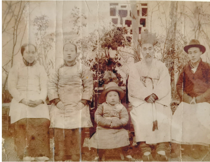
金沧江(右二)在南通合影。

昨天上午,在位于市区西南营历史文化街区的金沧江纪念馆,一场简约而不失隆重的开馆仪式,赢得在场中韩两国来宾的阵阵掌声。金沧江先生是韩国史学家、爱国诗人,是韩国李朝后期的四大文豪之一,在民间有“韩国屈原”之称。1905年,因自己的国家被日本侵略,金沧江先生带着家人流亡中国。危难之际,张謇先生施以援手,聘任这位异国诗友在南通翰墨林印书局任编校工作。这两位都有着深厚爱国情怀的名人,从此相聚于通城,为后人留下瑰丽的诗篇和友谊的佳话。