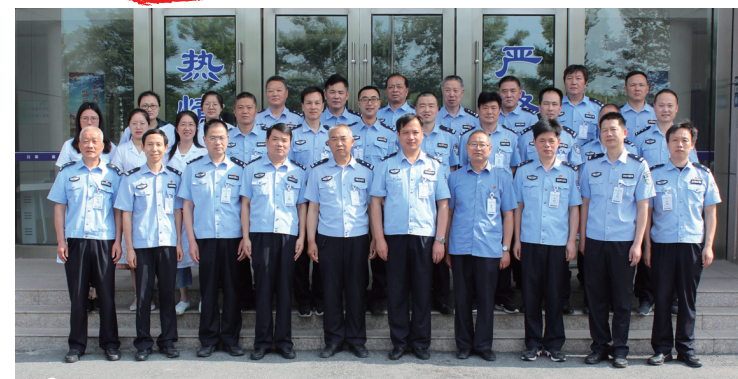
6号 海门区公安局监管大队:打造全国标兵看守所