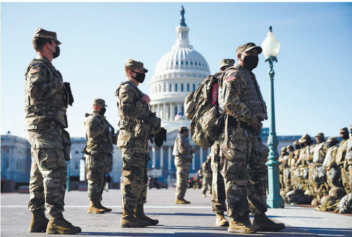
在美国首都华盛顿特区的国会区域拍摄的美国国民警卫队士兵。

美国当选总统拜登就职典礼将于1月20日在首都华盛顿特区举行。连日来,华盛顿特区中心地带的安保措施日趋严密,国会大厦四周竖起高高围栏,围栏内外有众多国民警卫队队员持枪巡逻。联邦机构、市政府、交通部门和航空公司14日接连升级安全措施,希望典礼前后不再生乱。