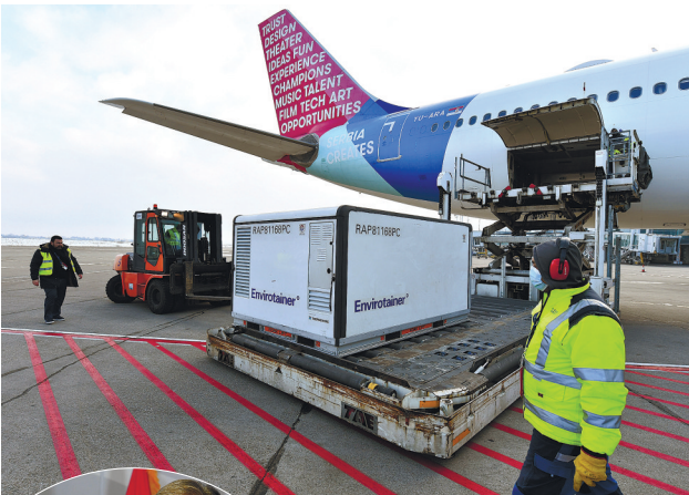
▲塞尔维亚工作人员卸载100万剂中国生产的新冠疫苗。

据当地媒体报道,塞尔维亚已经和多家疫苗厂家达成800万剂新冠疫苗的采购协议,采购包括中国国药集团疫苗、俄罗斯“卫星V”疫苗以及美国辉瑞制药有限公司与德国生物新技术公司联合研发的疫苗。