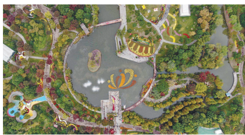
在唐闸公园举办的崇川区首届菊花展。

濠河景区景观提升工程成效明显,滨江、任港湾、五龙汇、平潮高铁西站等片区加快规划建设,城市轨道交通1、2号线有序推进……新年伊始,南通城市建设以“开局即决战、起跑即冲刺”的奋斗姿态掀起大干实干热潮。乘风破浪、踏浪前行,这座努力构建江海相拥、内外相融的城市频频“高光闪耀”,正朝着“大城时代”阔步迈进。