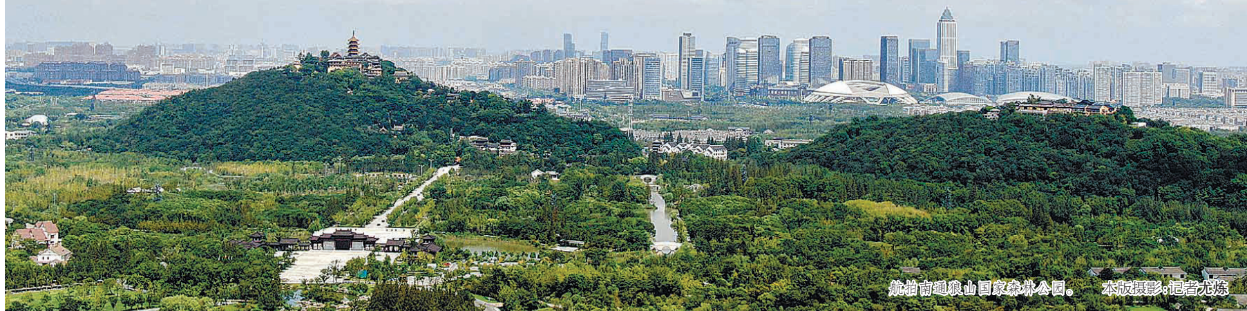
航拍南通狼山国家森林公园。