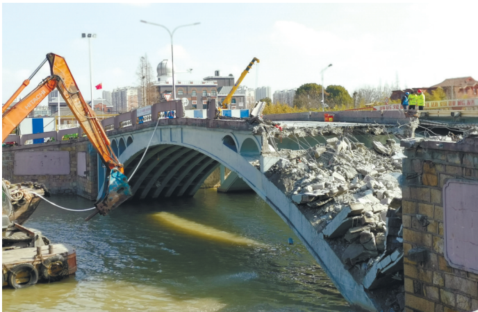
北幅桥梁开始拆除。市政设施管理处

晚报讯 “服役55年”存在安全隐患,唐闸大桥北幅桥梁昨天正式开始拆除。记者从市市政和园林局和交警部门获悉,出于安全考虑,截至本月24日前,同步对南幅桥面进行封闭,禁止车辆和行人通行。 唐闸大桥位于唐闸古镇正中心,东临河东路,西靠城闸路。唐闸大桥为新老两座桥梁拼合而成,北幅桥梁建于1966年,为钢筋混凝土双曲拱桥,是连接河东、河西的重要通道。 2020年11月22日,养护单位市政设施管理处在日常桥梁巡查中发现,唐闸大桥北幅桥梁受到船只由南向北的撞击,导致下部2根拱肋断裂,另有部分拱肋开裂受损。市政设施管理处紧急组织检测单位到现场对该桥进行深度检测,并召集相关专家对桥梁的处置方案进行会商。经专家评定,北幅桥已超过设计使用年限,且主拱圈严重受损,属于