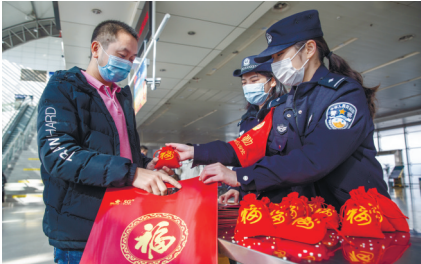
昨天,南通火车站派出所民警为旅客送上装有腊八粥食材的福袋。

员将甜甜的腊八粥和浓浓的节日祝福,送到了老人们的手里,既弘扬了尊老、爱老、助老的传统美德,又让老人们感受到社区大家庭的温暖。 此次新园社区通过群众喜闻乐见的方式,传承中华民族优秀传统文化,为喜迎新春佳节增添更多年味、趣味。 通讯员王艺 记者黄哲