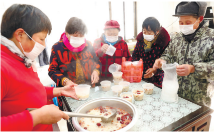
昨天,当地居民在通州区兴仁镇太阳殿村普昭禅寺分享腊八粥。

南通报业分类信息线上推送平台正式开通,南通日报微信、江海晚报微信、南通发布APP同步推出,百万粉丝平台加持,有效信息轻松获取!