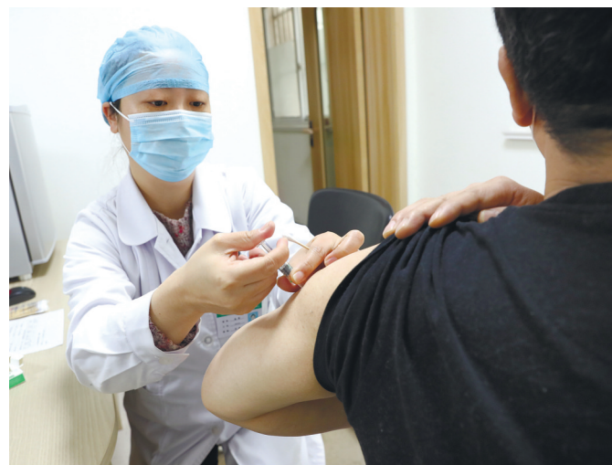
24日在南通一处社区卫生服务中心拍摄的新冠疫苗接种的画面。医务人员按照新冠疫苗接种流程为市民接种疫苗。按照统一部署,江苏省正在对部分重点人群有序开展新冠疫苗的接种工作。截至1月20日24时,全省累计接种新冠疫苗31.43万人、合计41.1万剂次。