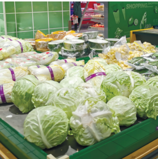
随着气温回升,我市蔬菜上市量增加,价格呈回落态势。 记者唐佳美

晚报讯 临近春节,眼下正是消费者集中采购年货的时候,农产品市场运行形势成为社会关注的焦点。春节期间农产品生产形势如何?供给有没有保障?昨天,市农业农村局有关负责人表示,当前,我市生猪产能恢复势头良好,猪肉市场供给持续改善,畜禽、蔬菜、水产品生产稳定、供给充足,“菜篮子”总体生产稳定。 受节日消费拉动以及前期强寒潮天气等因素影响,近期我市部分蔬菜价格上涨明显,但蔬菜生产总体稳定、供给充足。目前,全市在田蔬菜面积69.7万亩,较去年同期增加3.7万亩,预计一季度可上市蔬菜约117.64万吨,日上市量5000吨,可保证市场供应。但由于前期受寒潮低温影响,部分蔬菜有一定的冻害,上市量减少,造成价格与去年同期相比,呈现上升趋势。尤其是青菜类最高价近每公斤8元,是去年同期的2倍。随着温度逐渐回升,我市蔬菜上市量增加,价格呈回落态势,预计本月底后地头收购价可回落到正常水平。 春节是一年中的猪肉消费高峰期。2020年以来,在市场拉动和政策激励双重作用下,我市生猪生产持续恢复,产能提升,生猪市场供应持续改善。据行业生产数据显示,截至去年12月底,全市生猪存栏150.93万头,环比增加1.8%,能繁母猪存栏13.62万头,环比增加3.9%,生猪出栏265.94万头,环比增加23.8%。预计今年1至2月生猪可出栏量约为45.9万头。 此外,家禽生产平稳发展。数据显示,截至去年12月底,全市家禽存栏4997.49万只,同比下降7.3%,出栏1.15万羽,同比增加