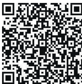
可观看相关视频。 扫描二维码