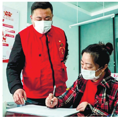
无偿献血志愿者在工作中。