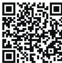
可观看相关视频。 扫描二维码