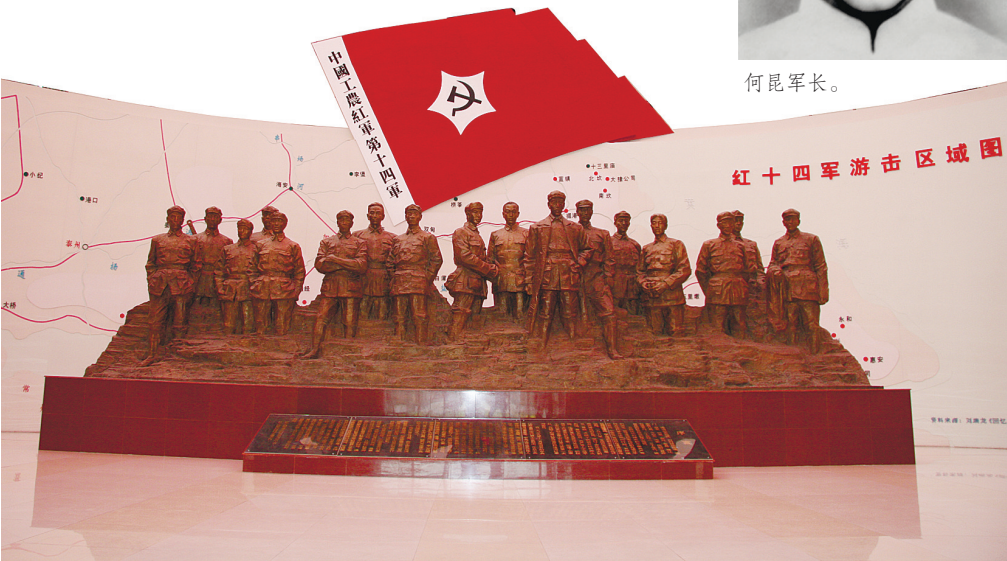
红十四军纪念馆内17名指挥员群雕。

“91年前,何昆军长就是在这里攻打老户庄时,献出了他年轻而又宝贵的生命。34年后,他的忠骸才被找到。”3月21日,站在红十四军老户庄战斗遗址前,年近七旬的陵园管理员朱勤富向记者介绍了何昆军长短暂而闪光的人生。 何昆是一位传奇式的英雄人物,1898年9月出生在湖南省永兴县。1925年,进入黄埔军校学习,在校期间加入中国共产党。1927年12月,参加广州起义。在白色恐怖的严峻形势下,他奉命到上海等地从事秘密革命工作。 走进红十四军纪念馆,何昆生前用过的行军床、枪弹盒、马灯等遗物,正在叙说这位红军骁将的英雄故事。1930年2月10日,他与张爱萍等4人,由地下党交通员护送,从上海乘船到泰兴口岸,2月14日抵达如皋西乡东燕庄,率部活动于南通、海门、泰兴等地,先后攻克敌人多个据点,粉碎敌人多次“进剿”,建立了通海如泰根据地。 “何昆军长来到如皋后,带领红十四军打的第一仗就给了敌人一个下马威。”1930年3月下旬,何昆率领红军首战靖江县长安市。午夜,战斗打响,敌人从梦中惊醒连衣服也没穿就逃了。红军缴获一批枪支弹药,并将据点及几家大地主家的财物、粮食分给贫苦农民,天色未明,红军迅即转移。 卢家庄是如皋西乡大地主集中的大庄子,连夜加固工事,写信请求夏堡地主李恺派遣一个班保家兵协助护庄。李恺是北平平民大学法律系毕业生,思想进步,暗中倾向革命,他将信函转呈何军长。何昆当即命一班战士,持李恺亲笔信,化装打进守敌内部。24日凌晨3时,红军土炮突然巨吼,战士如潮水般涌进庄内。这一仗全歼敌人60余名,擒获卢松庭、卢雨轩、卢祝山等7个恶霸,就地镇压。 如皋老户庄是重要战略据