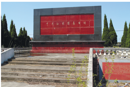
中共江北特委旧址纪念碑