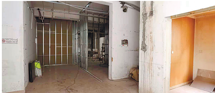
准备修建的卫生间。 记者周朝晖

“根据有关部门规定的兴办托儿所标准,我们将旺亚服饰有限公司的老厂房重新进行改造,目前相关建设工程正在紧锣密鼓进行之中。”赵先生告诉记者,“占地三层楼