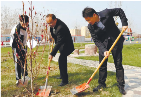
南通援疆教师团队在伊宁县进行植树活动。