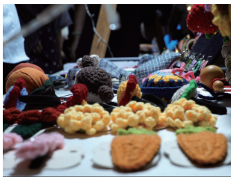
春日有约:非遗及文创产品集市