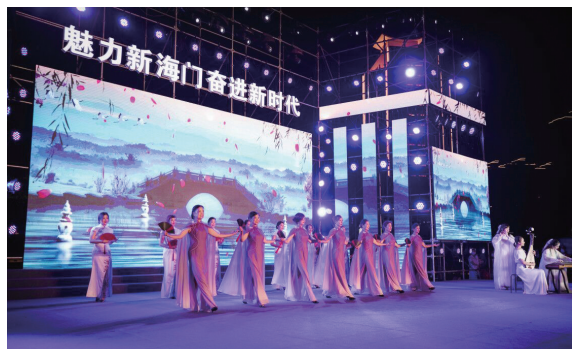
夏日激情:文旅夜市