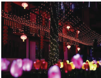
冬日浪漫:“窖里有约”灯会

晚报讯 15日,记者从海门区文广旅局获悉,海门从今年4月份开始推出“四季江海”文旅消费系列活动。这一活动旨在促进文旅经济发展,激发文旅消费市场潜力,营造文旅消费新场景,全面彰显“张謇故里 诗画海门”文旅品牌。