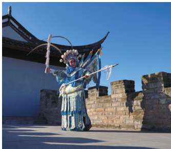
秋日缤纷:江海文化旅游节