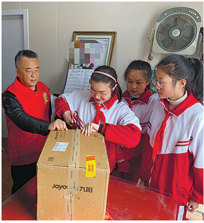
城中小学六(3)班的孩子们向困难家庭送去“小小心愿”。

冬去春来,通城迎来最美人间四月天。14日中午,南通市城中小学六(3)班的学生代表来到位于崇川区任港路的“城市更新驿站”,在任港街道城港社区工作人员陪同下,为本期困难家庭送去电冰箱、电饭煲等“小小心愿”。购买这些物资的费用,是孩子们暑假时摆地摊挣来的。