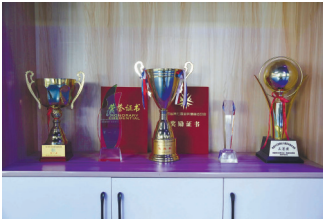
“绳童”们获得的奖励。