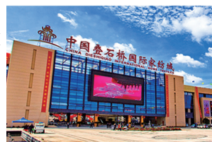
叠石桥国际家纺城