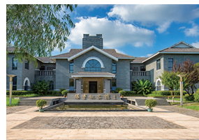
张謇文化旅游景区

●游览家纺之都、时尚之城——国家4A级景区叠石桥国际家纺城,赴一场世界家纺的嘉年华。这里景明水秀,是宜居的生态小镇;这里风云际会,是宜业的创造平台;这里琳琅满目,是宜游的购物天堂。这里是叠石桥,一个让你流连忘返、收获满满的地方。