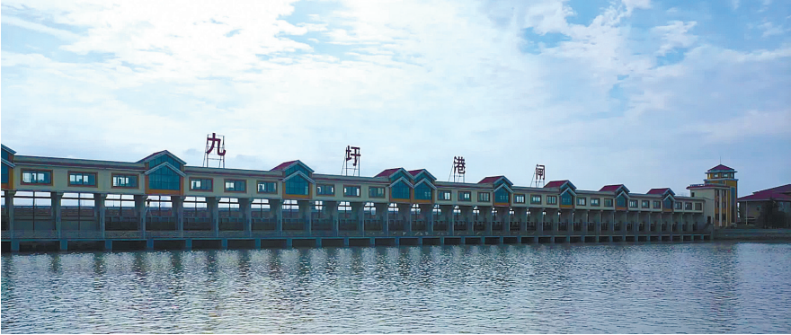
如今的九圩港闸。（资料图片）