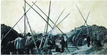
九圩港闸建设情景。（资料图片）