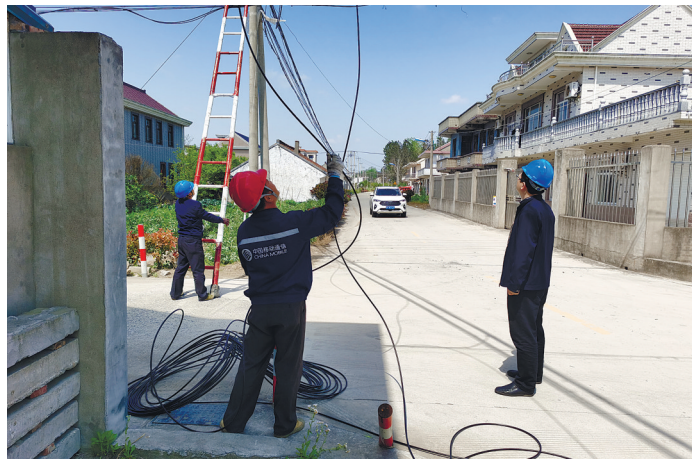
南通移动抢修人员正在清理被刮断的通信线路,为全市的通信网络畅通全面“保驾护航”。