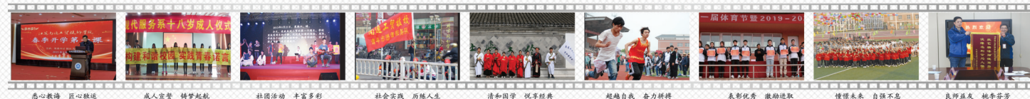
悉心教诲 匠心锻造