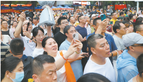
家长手持手机,寻找走出考场的孩子。