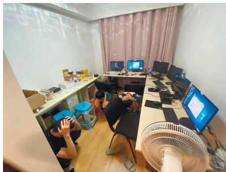
抓捕现场。

晚报讯 利用办理的大量银行卡,一群见不得光的不法分子专门为境外赌博、电信网络诈骗集团提供境内“洗钱”服务,成为犯罪“帮凶”。6月10日,崇川警方雷霆出击,在市区成功摧毁这一“黑灰产”团伙,抓获66名违法犯罪嫌疑人。短短一个月时间,该团伙的账户资金流水高达1亿元。