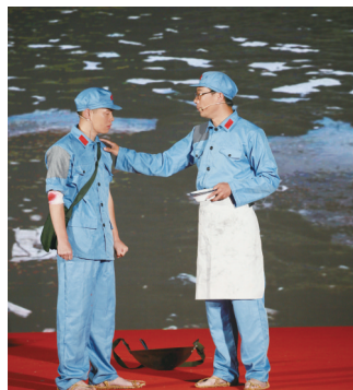
情景微党课《金色的鱼钩》