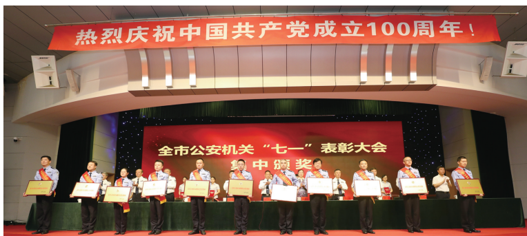
受表彰个人、集体上台领奖