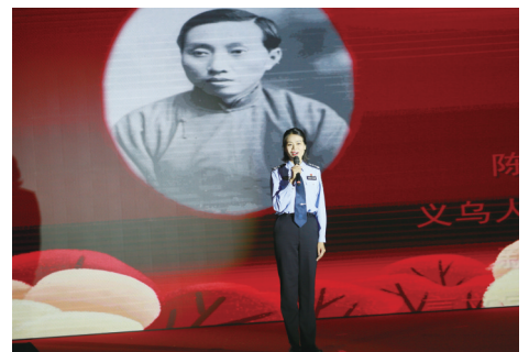
情景微党课《真理的味道》