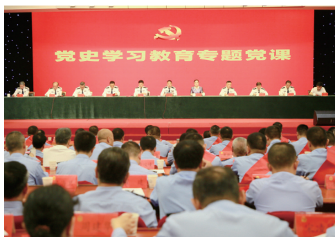
党史学习教育专题党课