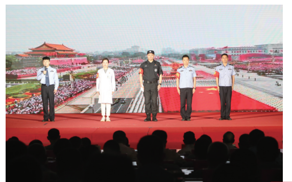
情景微党课《在磨难中崛起》