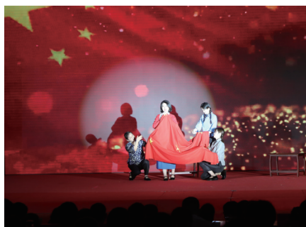
情景微党课《绣红旗》