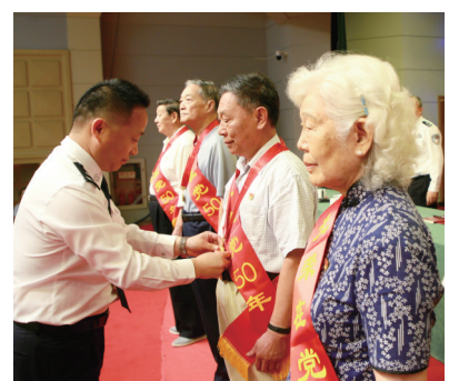
为老党员颁发“光荣在党50年”纪念章