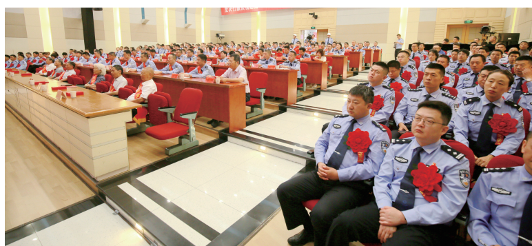
参加活动的功模代表