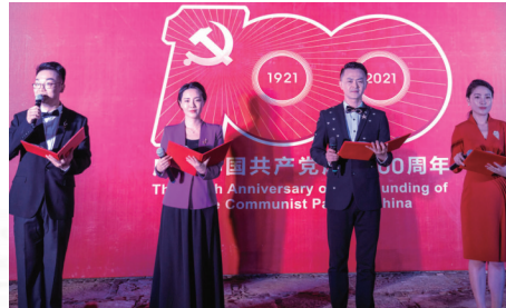
启东分会场 记者黄海