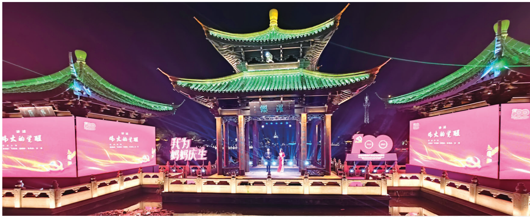
南通主会场 记者李波