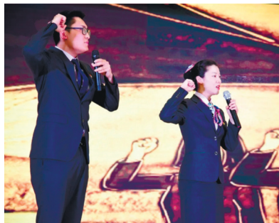
“农行青年说——我心向党勇担当”演讲比赛。

举办庆祝建党100周年党史知识竞赛, 使广大党员干部更加全面、准确、深入地学习党史, 在全行营造“学党史、悟思想、办实事、开新局”的良好氛围。