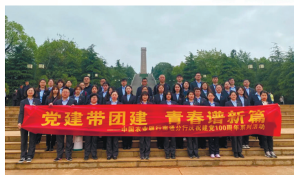
“党建带团建 青春谱新篇”活动。

组织开展“党建带团建 青春谱新篇”活动。由20多名青年党员带领20多名青年团员结伴同行, 通过参观红色教育基地, 开展党史学习, 进一步鼓舞青年员工爱党爱国热情, 激励青年员工提