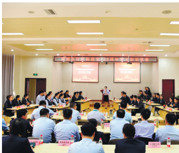
庆祝建党100周年党史知识竞赛。

合理论学习和工作实践, 讲述对习近平新时代中国特色社会主义思想的深刻领会、抒发对党和国家的忠诚之心, 对农行业务的赤诚之心, 对本职工作的担当之心, 大力唱响“一颗红心永向党、青春奋斗正当时”的主旋律, 为建党100周年、建行70周年献礼。