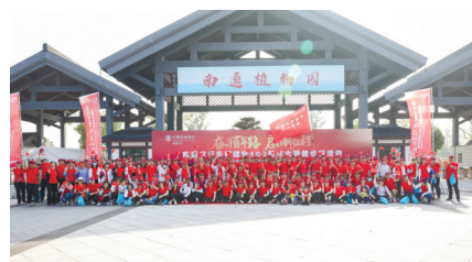
“奋斗百年路 启航新征程”主题健步行活动。