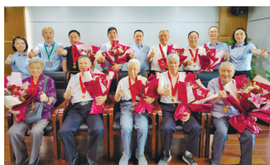
“光荣在党50年”纪念章颁发仪式暨新老党员座谈会。

参加南通西藏民族中学毕业典礼, 向结对帮扶的18名西藏学子送上毕业祝福, 愿他们感念党恩, 逐梦启航。