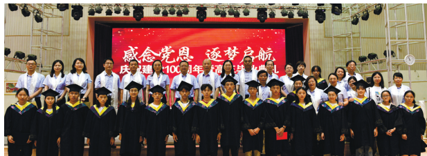
南通西藏民族中学毕业典礼。