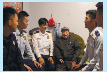
如东消防组织指战员走访慰问老红军，通过“听老红军讲党史”，激发消防指战员爱党爱国之情。