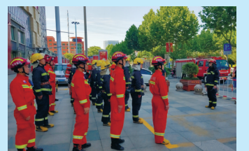
海门消防组织开展商业综合体灭火救援实战演练，提升指战员业务技能水平。