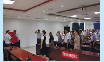
南通开发区消防与社区党支部开展学习消防知识、党员重温入党誓词活动。