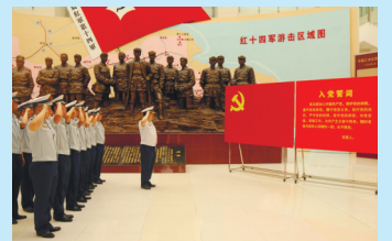
为进一步加强党史学习教育，如皋消防组织全体党员赴红十四军纪念馆参观学习。