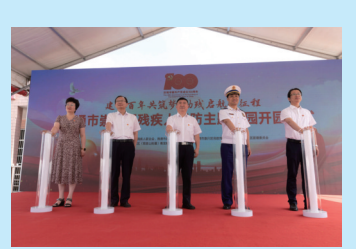
6月29日，全国首家残疾人消防主题公园在崇川开发区成功开园。

近日，在全市消防基层组织建设推进会上，支队按照“三统一、四规范”的建设标准，在全市建立首批乡镇（街道）消防管理服务所，并为试点单位的28名消防基层专职人员发放了消防巡查电动车、执法记录仪等巡防装备。今年以来，他们还深入开展单位开业检查告知承诺制、“双随机一公开”、执法办案查罚分离制度，用务实肯干的工作作风让群众真正得到实惠。