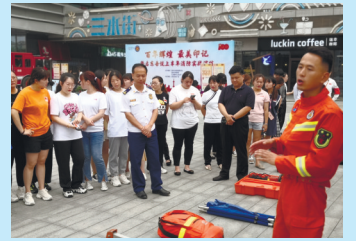
启东消防开展应急演练，全面检验队伍灭火救援综合能力。