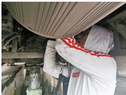
公交车维保人员在做车辆“体检”。

出梅入伏后,通城就开启了高温“炙烤”模式。昨天上午8时49分,市气象台继续发布高温橙色预警信号,又是一个37℃+的高温天。当不少人选择在空调房内享受清凉时,有这样一群人正为保障公交车的安全出行默默付出着。