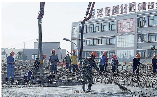
江海大道东延工程一标段工人正在施工。 记者尤炼

作为南通主城区与通州之间的主要交通大动脉,江海大道东延既是通州区衔接南通主城区的快速路,又是机场集疏运功能的区域快速通道,将极大推动通州与南通主城区一体化发展,促进区域间互联互通。目前,工程各项工序稳步实施,预计11月底即可完成主体结构,今年年底高架主线将实现全程贯通,2022年6月底前将全面竣工通车。 记者尤炼