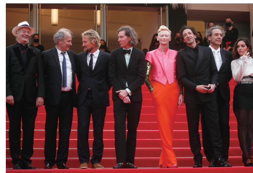
7月12日,导演韦斯·安德森(左四)、演员比尔·默瑞(左一)、伊波利特·吉拉尔多(左二)、欧文·威尔逊(左三)、蒂尔达·斯温顿(右四)、艾德里安·布洛迪(右三)等主创人员在法国戛纳亮相《法兰西特派》首映式红毯。