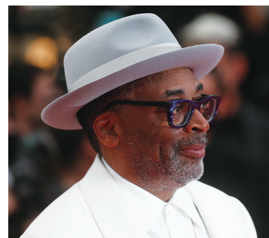
主竞赛单元评委会主席、美国导演和制片人斯派克·李亮相《法兰西特派》首映式红毯。