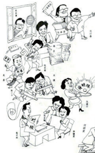
采编人员百态图 丁鸿章作

记者就是一名社会活动家。在晚报10多年,跟大家有许多愉快的合作,让我收获多多。我的体会是:做一名合格的记者,一定要有骨气、虎气和灵气,才能真正做到不忘初心、一心为民。