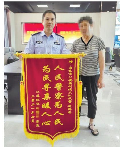
兰阿姨将锦旗送到启东市公安局刑侦大队民警的手中。袁竞 姜雨蒙

小贾的动向。7月9日,在上海警方和俞海忠的共同精准研判下,确定小贾频繁出入上海市康桥镇火箭村的网吧。赵磊一行火速赶往火箭村,几番周折后,当晚11点,终于在网吧里找到小贾。