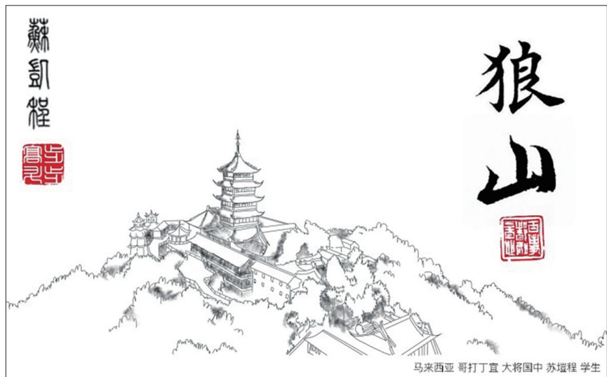
马来西亚 哥打丁宜 大将国中 苏耀程 学生