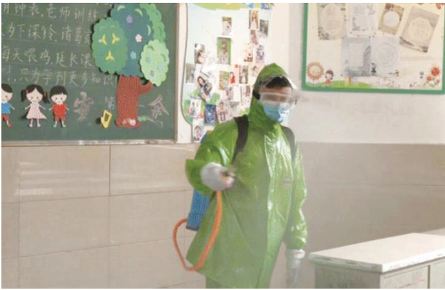
海安市教师发展中心附属小学正在对学校教室开展消杀。

昨天上午,我市启秀中学初一新生按照要求到校,他们在校门口测温通过后,第一次以该校学生身份踏入校园。秋季学期将至,我市各学校疫情防控工作进展如何,记者进行了探访。