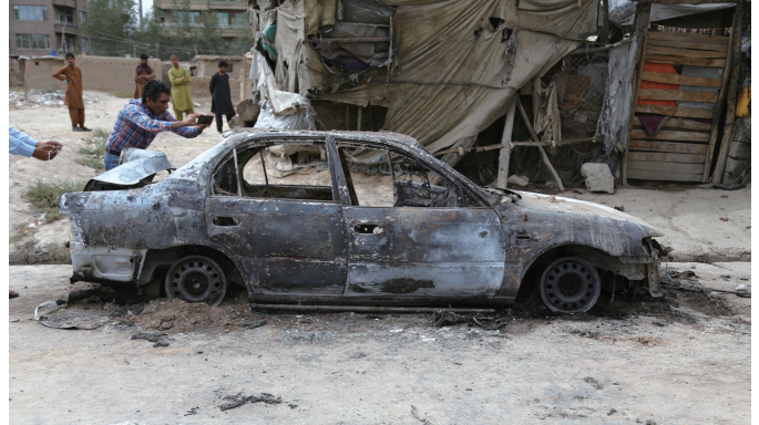
这是8月30日在阿富汗喀布尔拍摄的一辆毁坏的汽车,这辆汽车内部装有火箭弹发射装置,当日发射火箭弹后被毁。