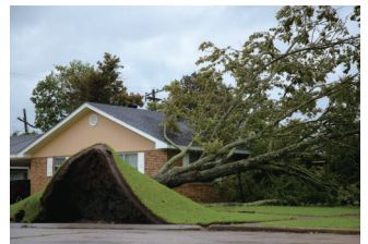
29日,在美国路易斯安那州摩根城,一棵大树被飓风吹倒。

美国电力监测网站的实时数据显示,截至美东时间29日23时,路易斯安那全州近百万户家庭和企业断电,密西西比州断电用户逾3万。强降雨还引发洪水,美国国家气象局29日晚发布紧急警告,要求路易斯安那州一些地区的居民尽快疏散到地势更高的位置避险。路易斯安那州是美国当前新冠疫情的重灾区之一,新奥