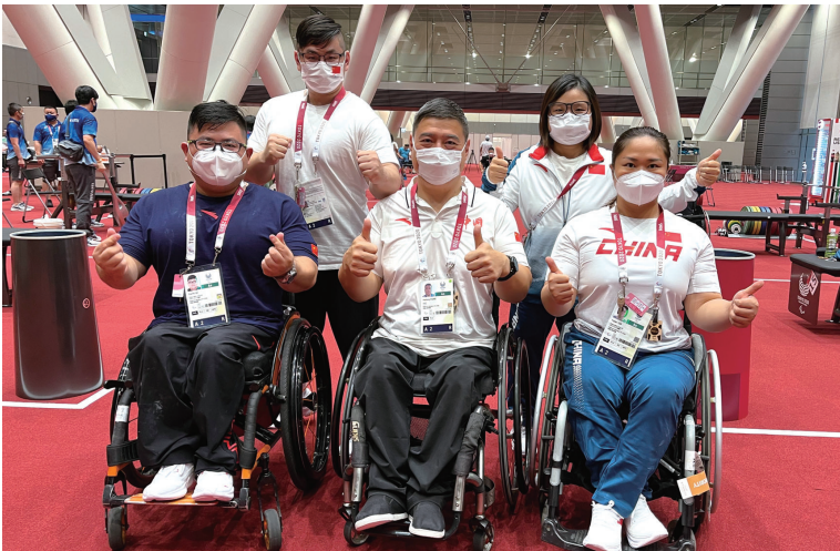
八月二十三日,张海东(前排中)与四名弟子在训练场合影。

牌。张海东凭借不俗战绩,在悉尼、雅典两届残奥会上担任中国代表团的旗手,先后荣获过全国五一劳动奖章、中国青年五四杰出贡献奖章等荣誉称号。