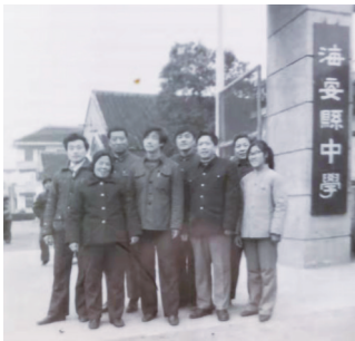
1984年,与同事们在学校大门前的合影。

一日偶然相遇,可能你已经记不起他(她)的名字,但他(她)看见你,高高兴兴、恭恭敬敬地叫一声“老师好”,那就是一个老师最大的幸福和满足!