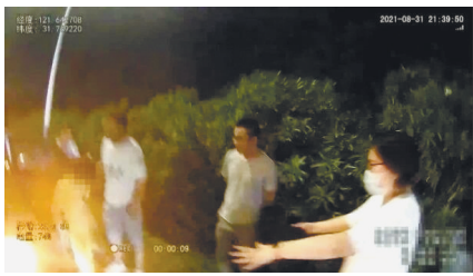
找到小女孩。