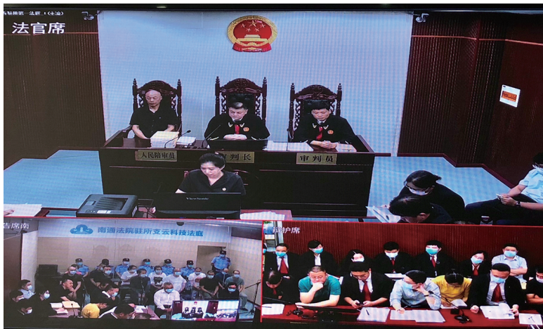
审判现场画面。

晚报讯 中艺财富文化艺术品投资管理中心有限公司江苏分公司以销售玉石、字画等投资理财产品为名,用高息做诱饵吸收资金,涉案金额高达34亿元。昨天,该公司14名员工非法吸收公众存款案在崇川法院一审宣判。其中,总经理杨某被判处有期徒刑九年十个月,并处罚金五十万元。案件宣判后,崇川法院向媒体通报了相关情况。