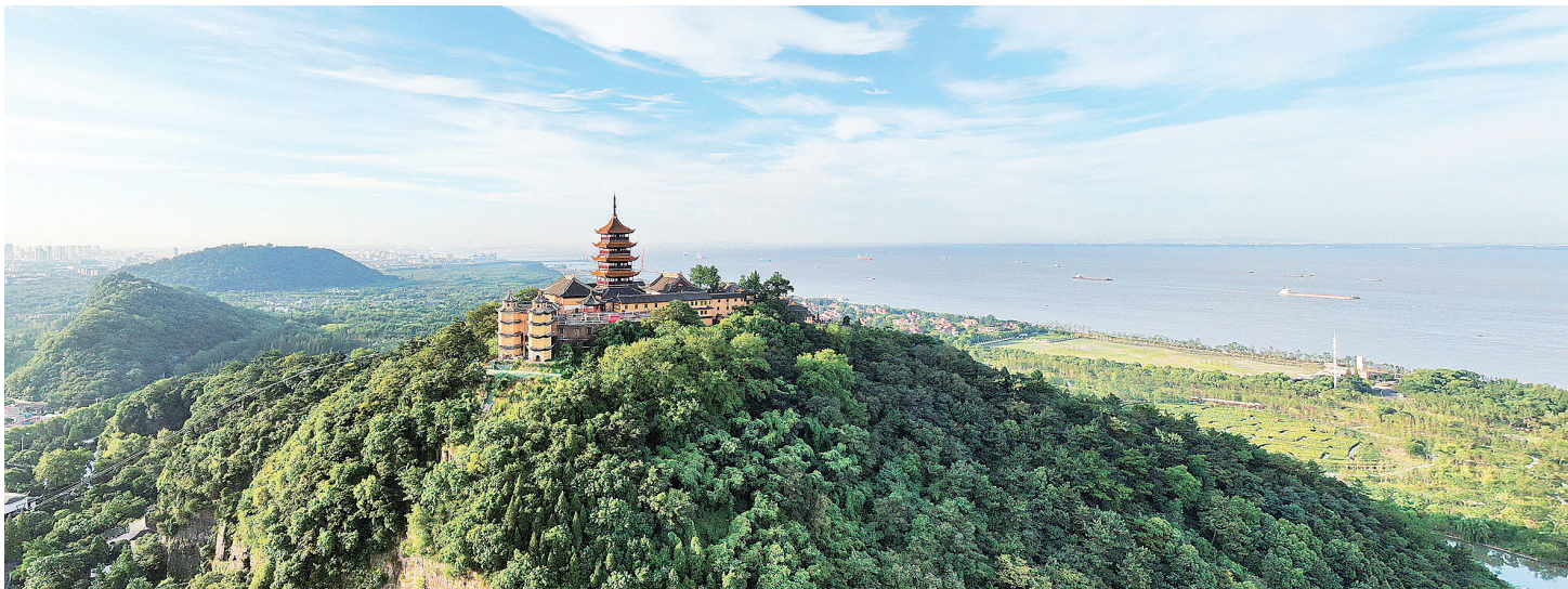
五山国家森林公园