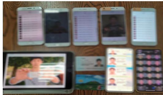
▲犯罪嫌疑人使用的部分作案工具。

据李某旗供述,他在网上发布“接单”广告后,很快就遇到了“金主”——电信网络诈骗、网络赌博、网络淫秽色情等犯罪分子。他们手上掌握了大量微信账号,很多曾用于实施电信网络诈骗或散布赌博、色情网站等非法广告被限制登录。