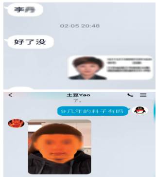
犯罪嫌疑人与“客户”的聊天截图。