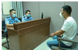
办案民警正在讯问犯罪嫌疑人。

2021年国家网络安全宣传周期间,南通警方昨天对外通报,在“净网2021”专项行动中,南通市公安局网安支队会同如皋市公安局网安大队成功破获一起新型网络犯罪案件,抓获犯罪嫌疑人5名,斩断一条为电信网络诈骗、网络赌博等犯罪团伙重启被限制登录微信账号的黑色产业链。截至案发,团伙利用“变脸”APP和某款智能手机的安全漏洞,共重启了上万个被限制登录的微信账号,非法获利上百万元。目前,5人因涉嫌诈骗罪、帮助信息网络犯罪活动罪被依法采取刑事强制措施。