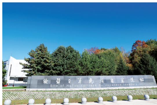
侵华日军虎头要塞遗址。

虎头要塞地下军事设施规模庞大、结构复杂、设施齐全,通往地面设有观测所、竖井、地堡、通风口,出入通道要隘处设有陷阱、射击口等作战设施。虎头要塞除了建有庞大的地下设施,还有完备的地面设施,日军在地面建立观察哨严密监视苏军动向,各式火炮、高射炮、高射机枪阵地,以及列车炮与巨炮阵地等地面设施,利用山地、丘陵,