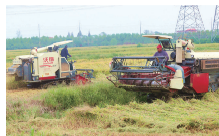
昨天上午,崇川区幸福街道现代农业产业集中区万亩水稻正式开镰收割,十多台收割机开足马力进行水稻收割作业。