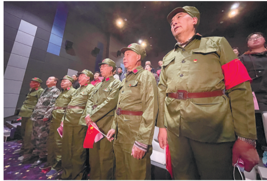
昨天,崇川区首个老兵宣讲团——钟秀街道校西老兵强国宣讲团成立。宣讲团的30余位成员平均年龄69岁。当天,宣讲团在现场通过“赛军歌”等方式展开“强国好家风”的主题宣讲。 记者黄哲