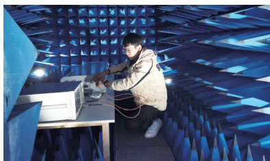
中天通信的实验室

“5G天线一般都是架设在高高的信号塔上,除了自身的相关性能外,防风、防雨、防晒等‘本事’也不能少。”随着揭水平的脚步,一个个实验室的门被打开,这里有国内目前最大的淋雨模拟场、有犹如科幻大片的巨大橙色圆环的室内近场测试暗室……每一个都显示